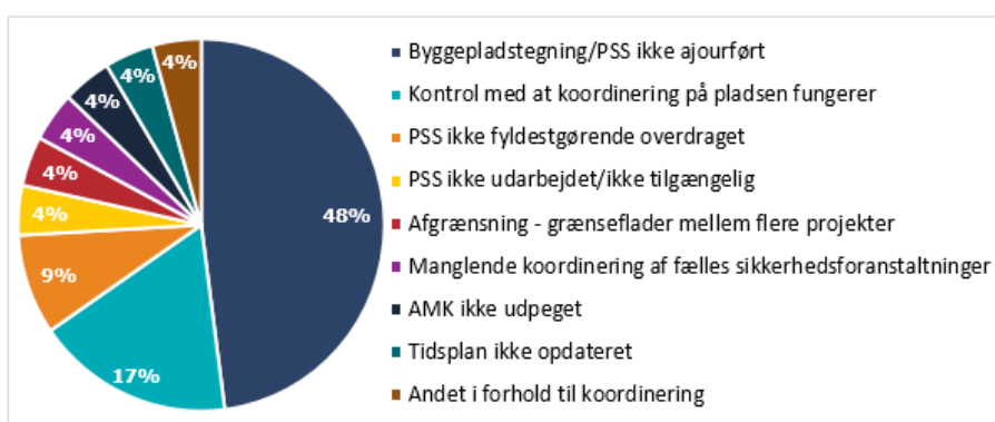
Figur: Begrundelser for påbud til Banedanmark som bygherre i 2017

I 2017 har Banedanmark som bygherre fået 24 påbud, hvoraf knap halvdelen af påbuddene skyldtes, at byggepladstegningen eller Plan for sikkerhed og sundhed (PSS) ikke var ajourført. Knap 20% af påbuddene skyldtes mangelfuld kontrol med arbejdsmiljøkoordineringen. De 24 påbud fordeler sig således: