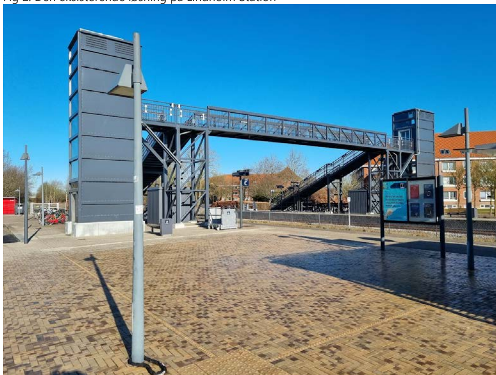
Fig 2. Den eksisterende løsning på Lindholm Station

I dag er der opsat en gangbro, der inkluderer to elevatorer og trapper. Gangbroen lever op til TSI-standard og har forventet lang levetid. Banedanmark anbefaler en drøftelse med Aalborg Kommune om at lade gangbroen være en permanent løsning.