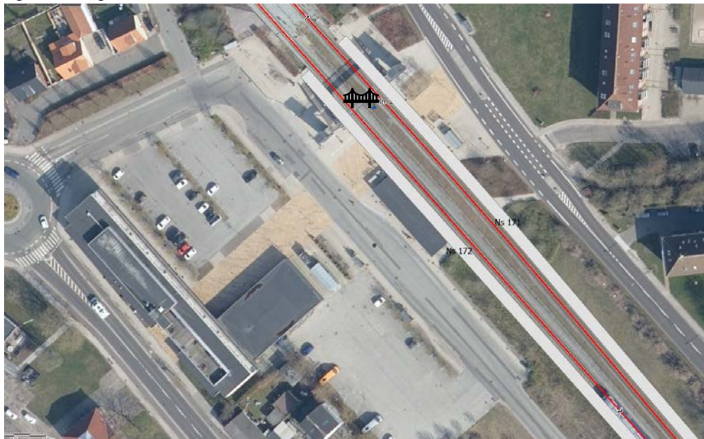
Fig. 1. Oversigtskort over stationen

På Lindholm station er toghastigheden 120 km/t med en frekvens på fem tog pr. time. Selvom frekvensen er lav, vil den eksisterende sporovergang få en stigende antal passanter grundet den nye bane til Aalborg Lufthavn. Stationen benyttes i dag dagligt af 650 passagerer.