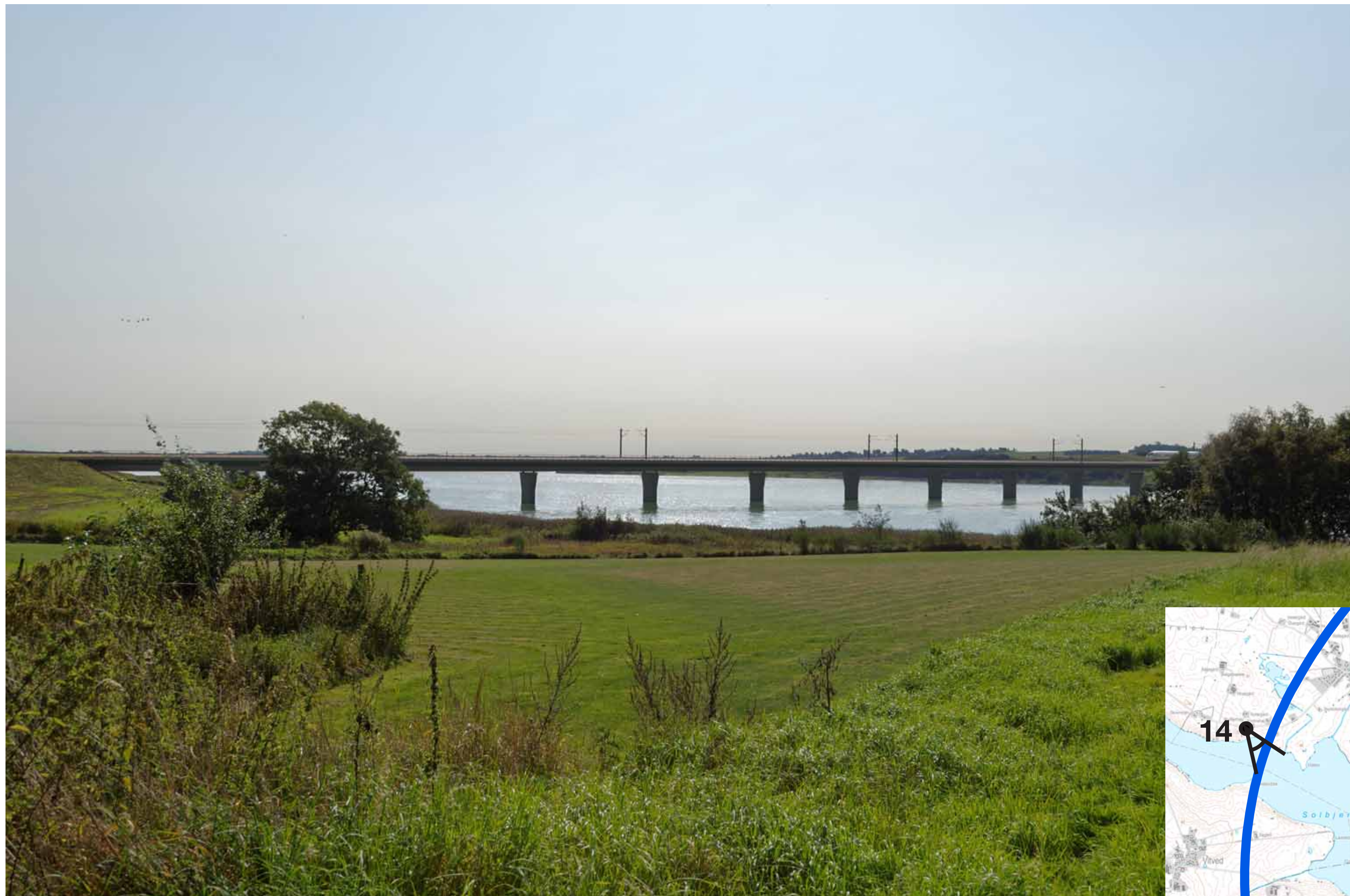
Visualisering af løsning