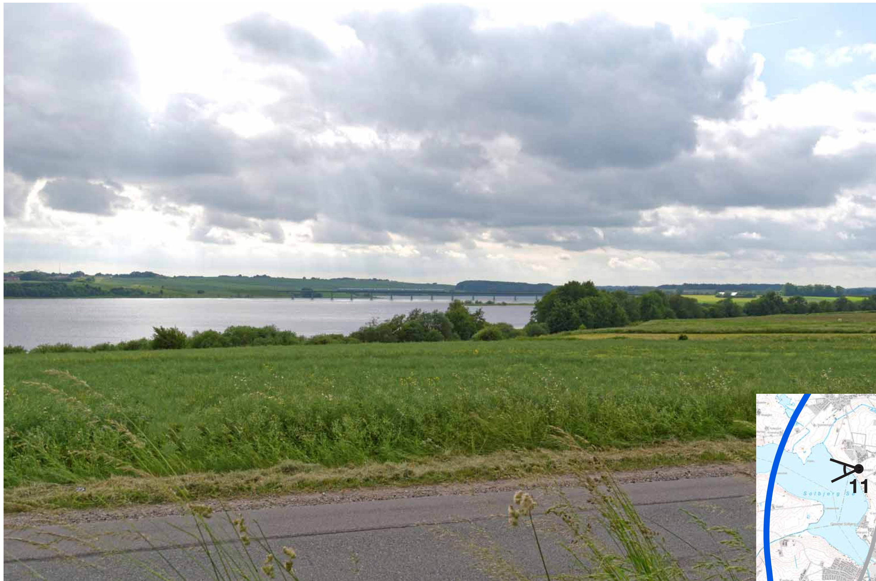
Visualisering af løsning