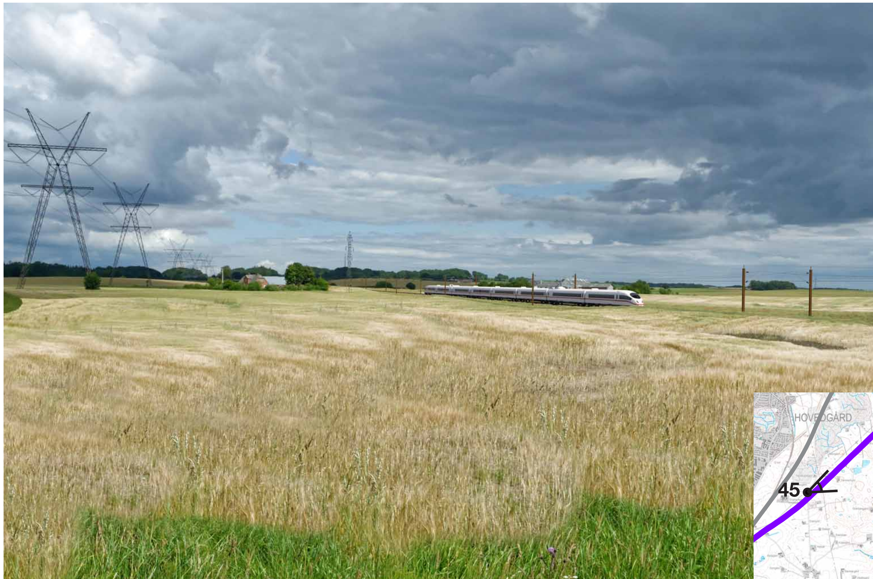
Visualisering af løsning