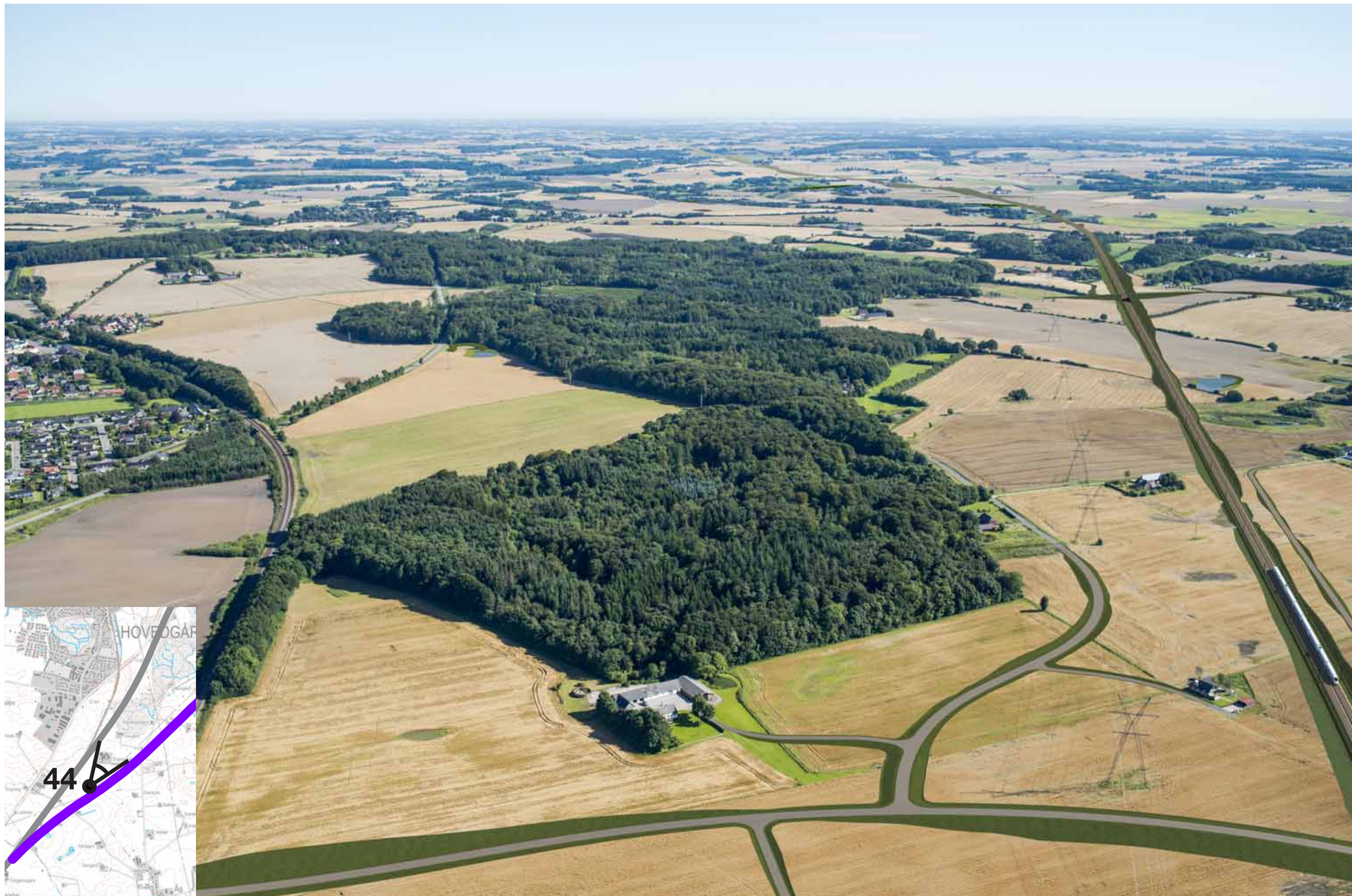
Visualisering af løsning