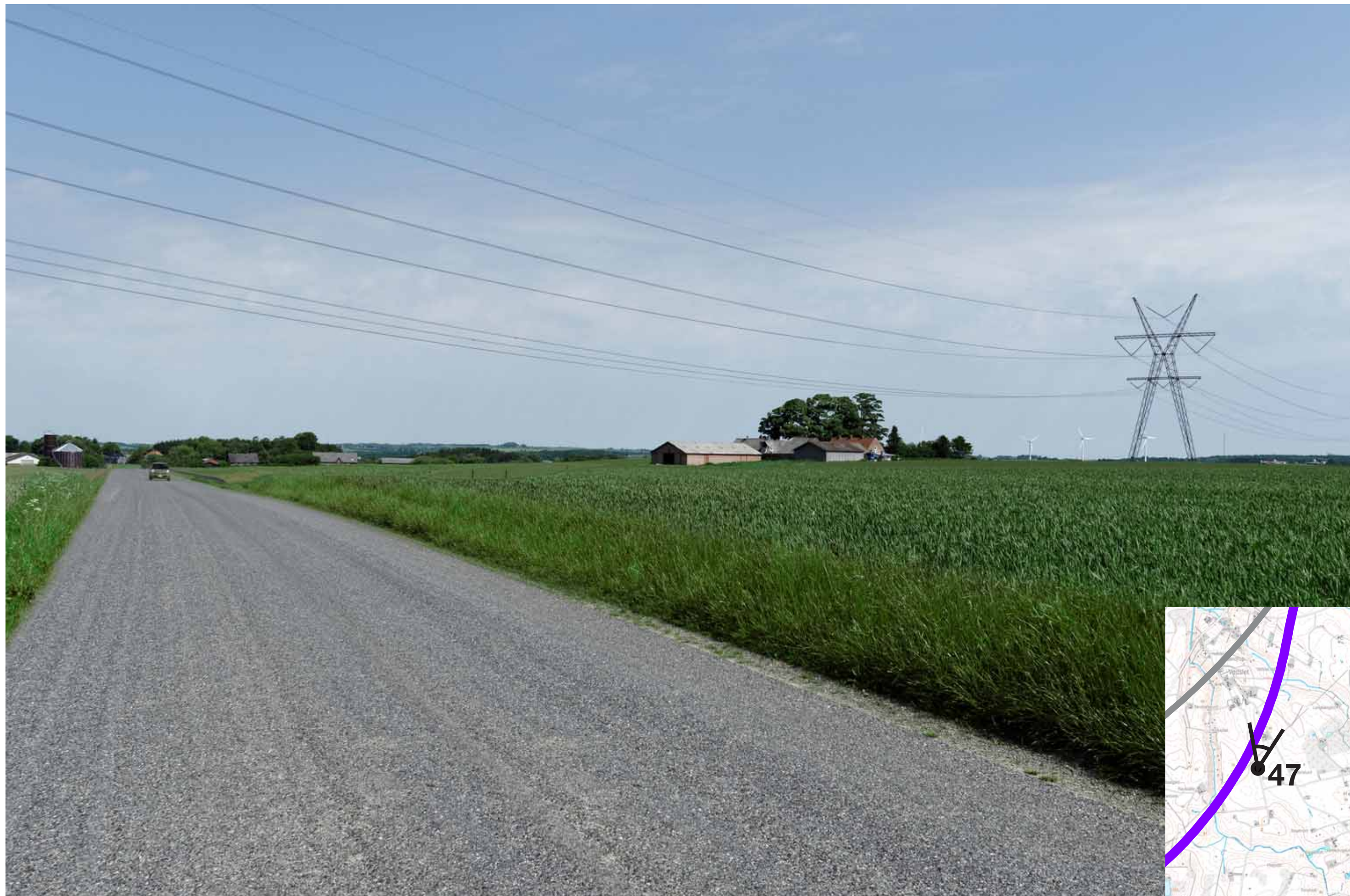
Visualisering af løsning