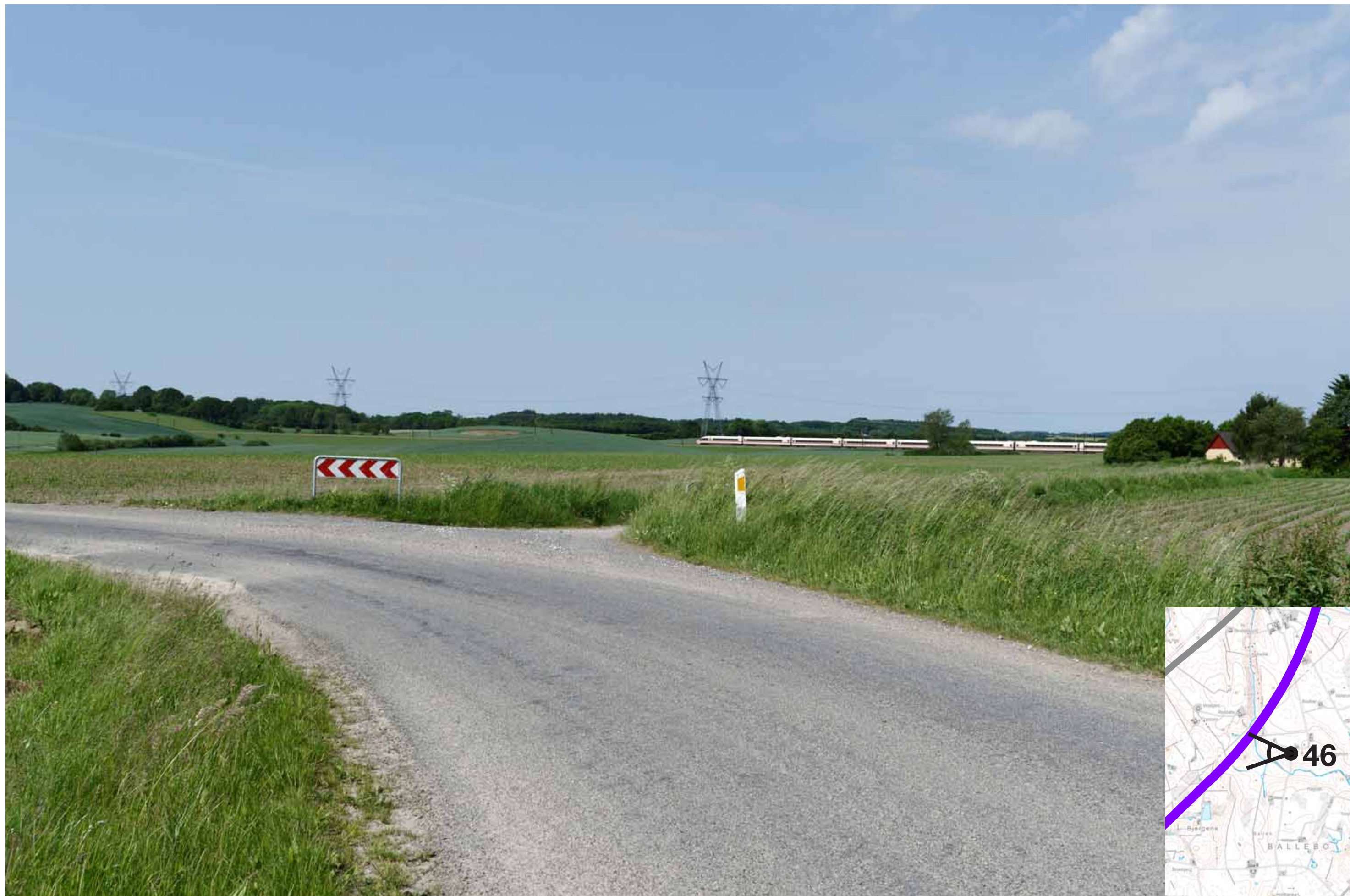
Visualisering af løsning