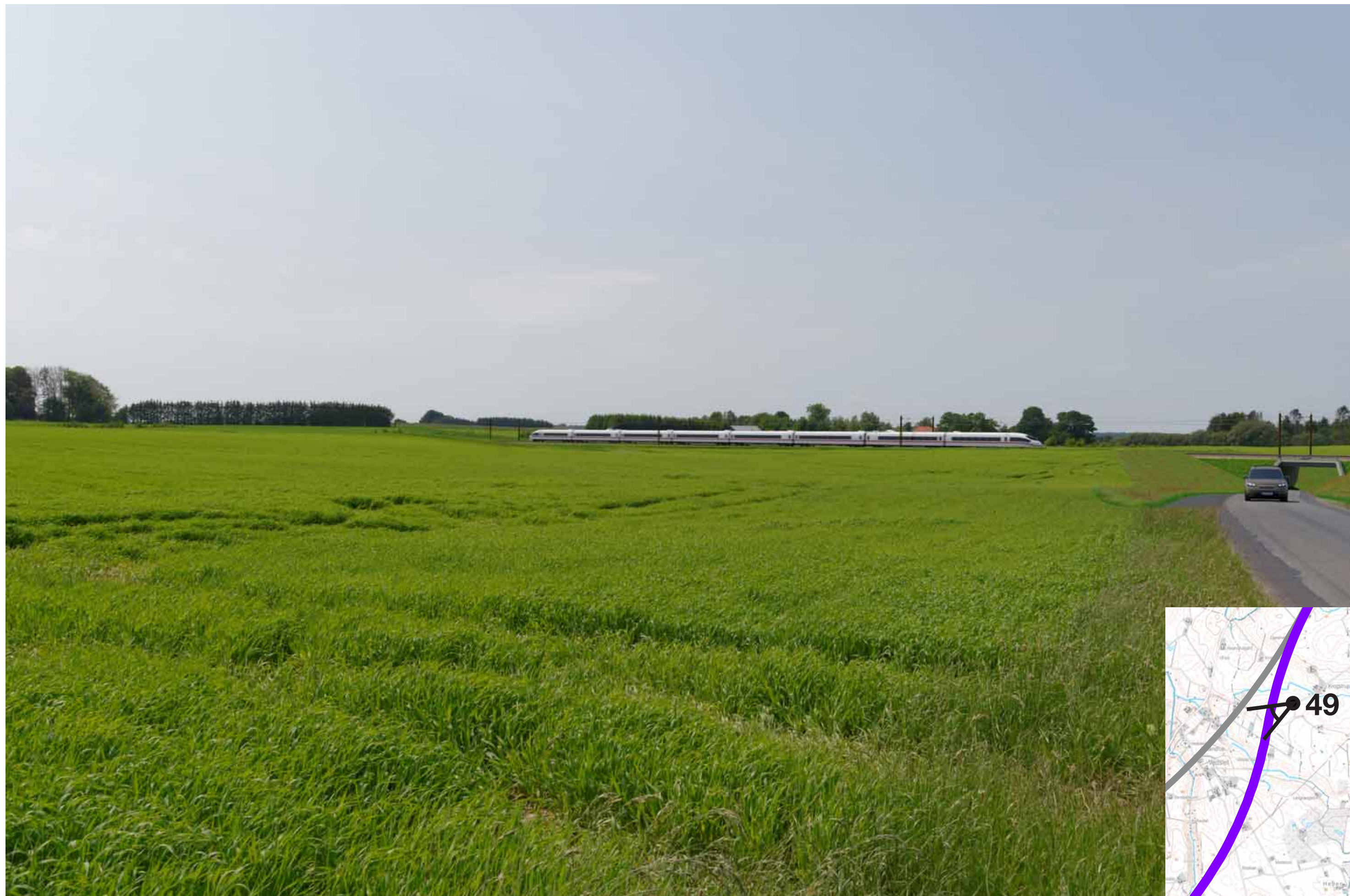
Visualisering af løsning