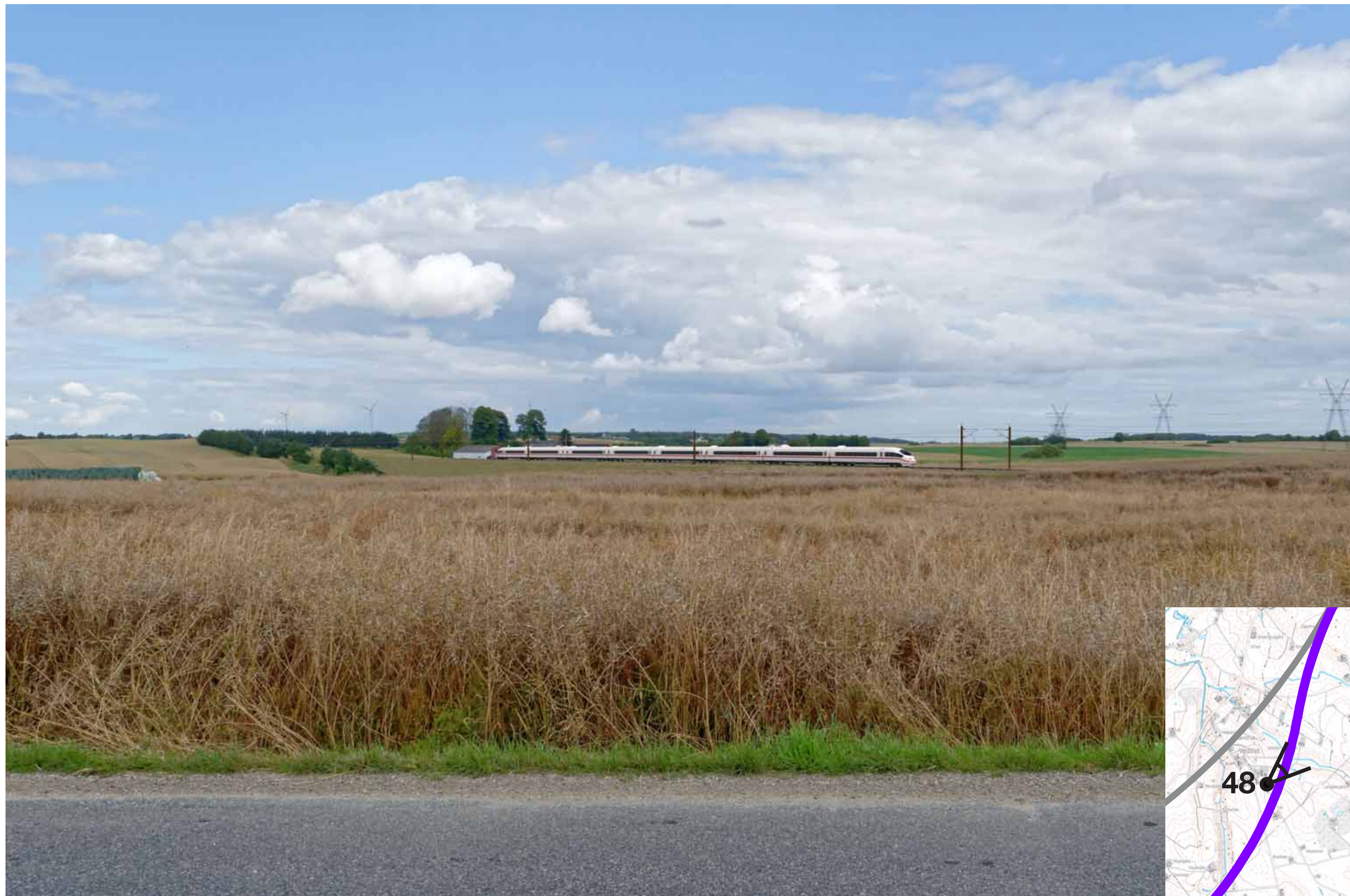
Visualisering af løsning