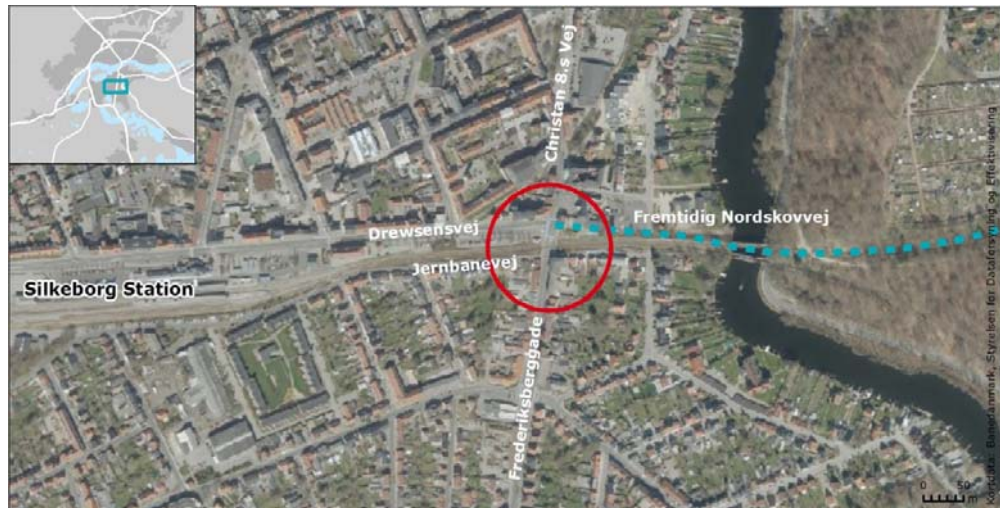
Figur 1: Oversigtskort

Med afsæt i det ændrede scope redegør denne forundersøgelse for mulighederne for at etablere en niveaufri løsning ved overkørslen.